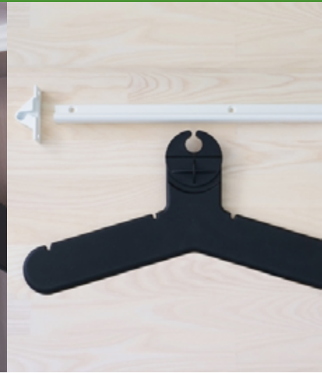
J-trac sicherer Kleiderbügel