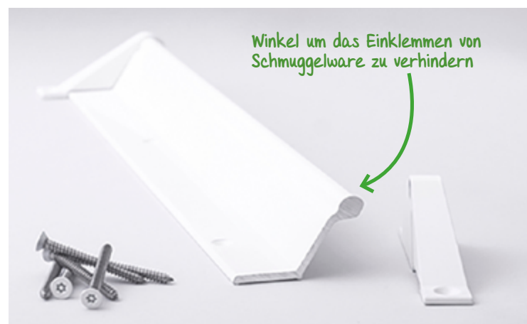
J-trac Gardinenschiene mit Wandbefestigung