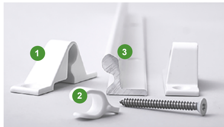
J-trac Gardinenschiene mit Deckenbefestigung. Die J-trac Gardinenschiene besteht aus drei Teilen: 1. Endanschlag 2. Gardinenhaken 3. Schiene

Das Sicherheitsdesign unserer Gardinenschiene ermöglicht auch die Verwendung in einem Kleiderschrank mit speziell entwickelten, unzerstörbaren Kleiderbügeln.