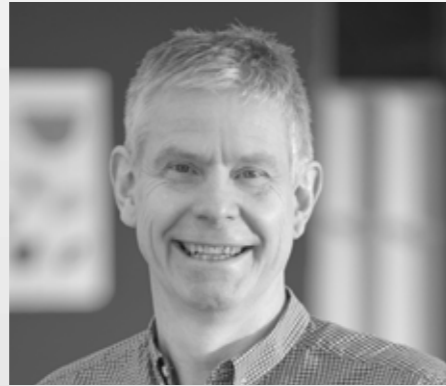
Entworfen von Ingemar Jonsson

Die standardmäßig stark beschwerte Ryno®-Reihe wurde entwickelt, um das störende Verhalten zu begrenzen. Für Umgebungen mit erhöhtem Risiko können die Produkte mit unserer Methode der verdeckten Bodenbefestigung (Patent angemeldet) sicher am Boden befestigt werden.